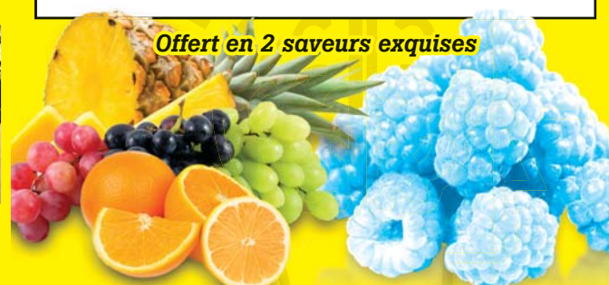
Punch aux fruits

Ingrédients non médicinaux: Acide citrique, maltodextrine, acide malique, arômes naturels et artificiels, dioxyde de silicium, sucralose, acésulfame-K, poudre de jus de légumes et de fruits (colorant).